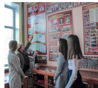
Экскурсоводы музея, ученики 8г класса