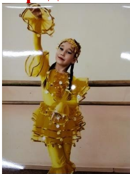
Урок «День национального костюма» в 4Д классе